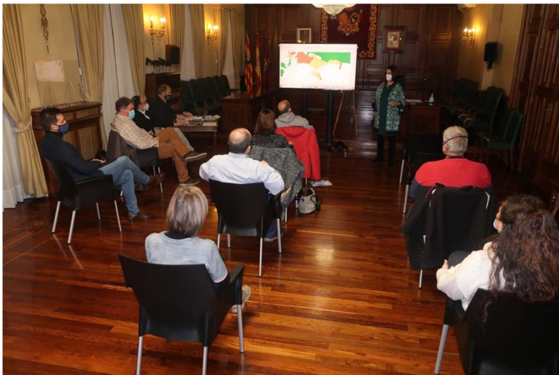
Imagen 1. Sesión informativa. Asociación de vecinos San Julián

Para la consecución de este objetivo, todas las fases de elaboración del PGOU contemplan diversas herramientas de participación, entre ellas, en la fase de avance y en la de aprobación inicial, la celebración de sesiones informativas destinadas a los colectivos y asociaciones vecinales representativas de los barrios de la ciudad, incluidos, por supuesto, sus barrios pedáneos.