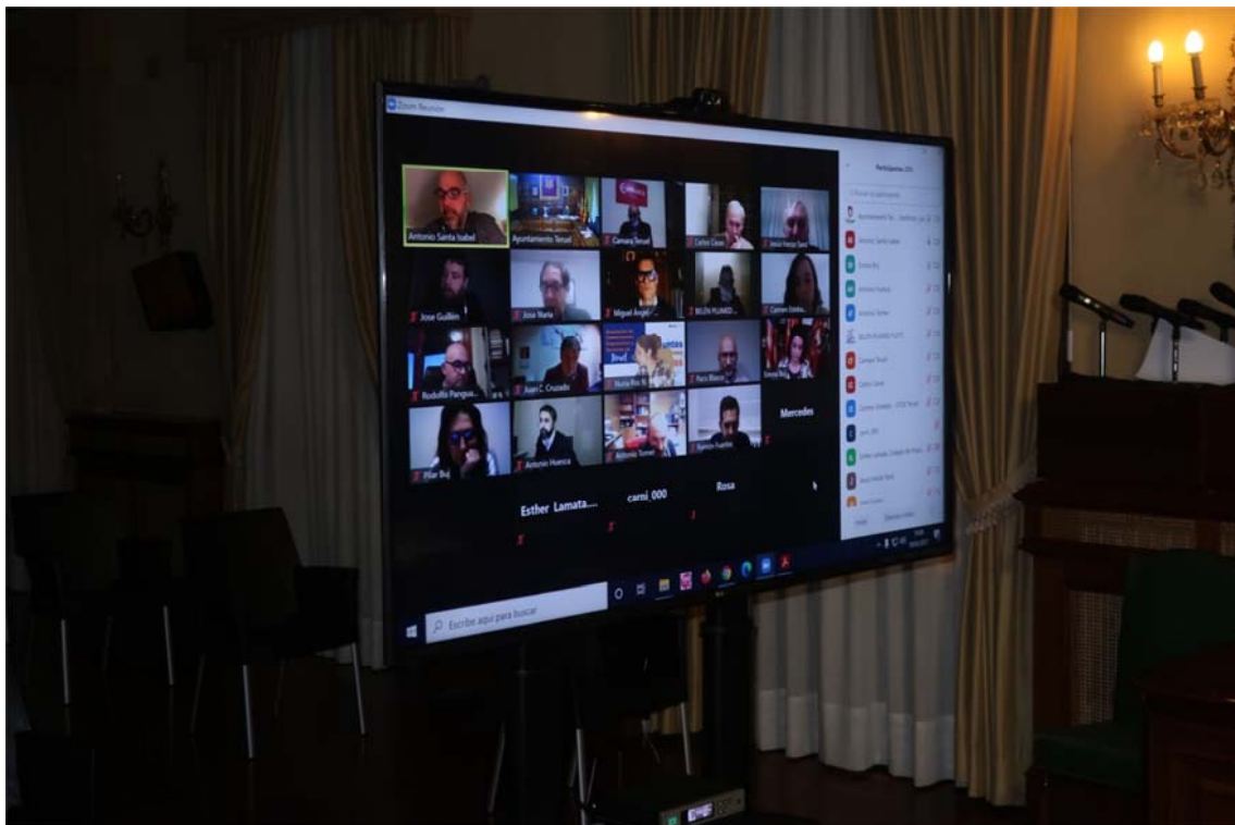
Imagen 1. Sesión informativa. Colegios Profesionales, Sindicatos, Asociaciones Empresariales y Asociaciones de Comerciantes

Para la consecución de este objetivo, todas las fases de elaboración del PGOU contemplan diversas herramientas de participación, entre ellas, en la fase de avance y en la de aprobación inicial, la celebración de una sesión informativa destinada a aquellos colectivos más estrechamente vinculados con la cuestión, como colegios profesionales: Colegio Oficial de Arquitectos, Colegio Oficial de Ingenieros de Caminos, Canales y Puertos..., por citar algunos ejemplos representativos, así como también sindicatos y asociaciones de comerciantes y empresariales.