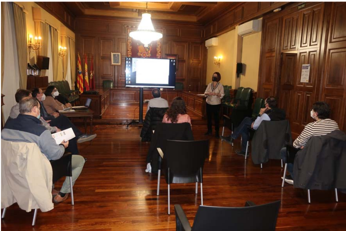
Imagen 1. Sesión informativa. Promotores y constructores

Para la consecución de este objetivo, todas las fases de elaboración del PGOU contemplan diversas herramientas de participación, entre ellas, en la fase de avance y en la de aprobación inicial, la celebración de sesiones informativas destinadas a colectivos y asociaciones, entre ellos, los promotores y constructores de la ciudad.